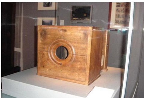
Ж. Ньепстің тұңғыш фотоаппараты (1826 жыл)